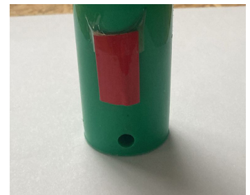
Logement de l'inflamateur