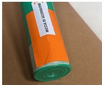
Retirer la protection de mèche