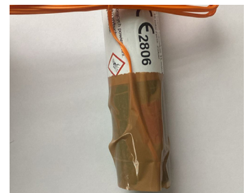
Ruban adhésif pour maintenir